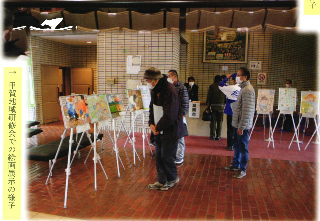
→ 甲賀地域研修会での絵画展示の様子