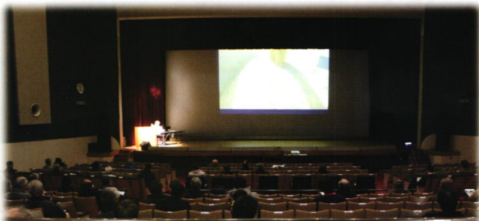
← 東近江地域研修会の様子